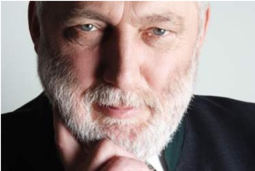
Dr. Franz Fischler , ( A )

Szenárió 2020 – Európa a gazdasági siker útján, a tiszta minőségpolitikának köszönhetően