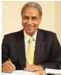
Prof. Dr. Ibrahim Abouleish